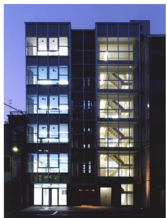
店舗改装工事(2009年) 事務所ビル再生工事(2007年)