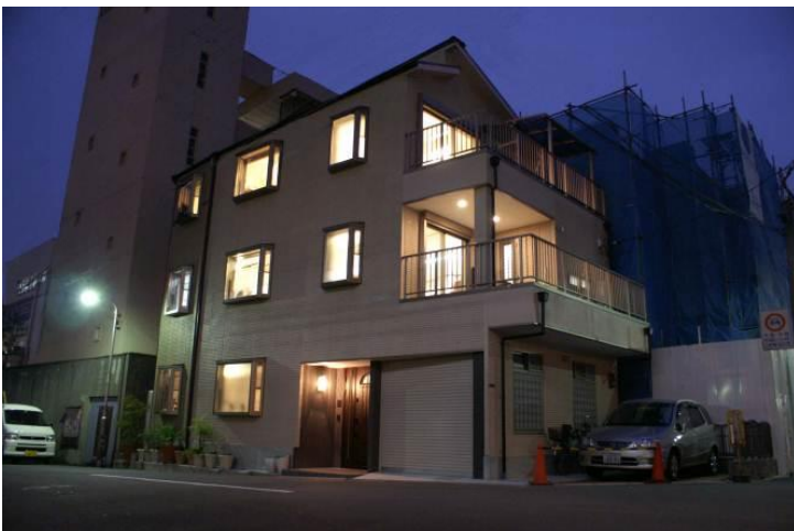
Y 邸新築工事(2011 年)